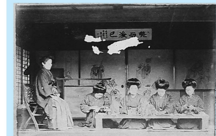
私立大原裁縫学校の様子

本展では今日の私たちの礎となった女子教育と文化の歴史を、私立大原裁縫学校の資料を中心に紹介します。