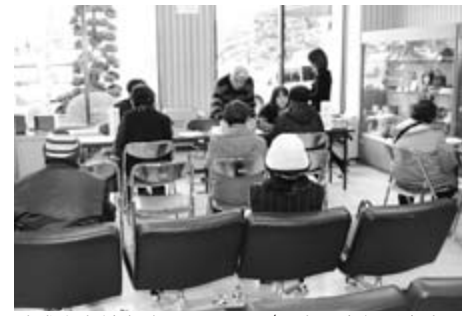
助成券交付申請はお早めに（写真は市役所本庁での受け付けの様子）

次のような場合は問い合わせを市から通知がなかった世帯であっても、次のような世帯で、右記の「対象世帯」に該当すると思われる場合は、問い合わせください。 ○19年1月2日以降に市内に転入し、前住所地における19年度市町村民税が非課税の人がいる世帯 ○18年中の収入が遺族年金・恩給・障害年金などのために、申告の必要がなかった人がいる世帯