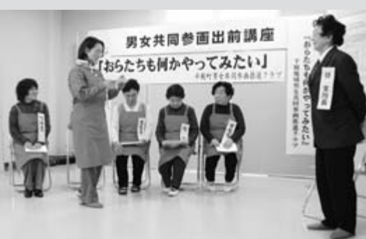
家族経営協定をテーマにした寸劇『おうちも何かやってみよう』

千厩地域男女共同参画推進クラブは、旧千厩町の町民大学「男女共同参画コース」で学んだ人を中心に、男女共同参画に興味や関心を持った21人で構成されている団体です。