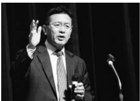
ユーモアあふれる語り口で聴衆を魅了した瀬古さん

毎年「瀬古杯」マラソン大会が開かれてはいる本市には、何度も訪れています。 ロサンゼルス、ソウルの2度の五輪に出場し、メダル候補といわれながらメダルを逃した経験から「五輪のメダルには、『運』、プレッシャーに負けない『鈍』、根気、根性の『根』の三つが必要」「家に帰ってから、『お父さんは世界一』と家族にももらった金メダルはうれしかった。思いを言葉で表現することはとても大切なこと。子どもはほとんど褒めて育てて」と聴衆に語り掛けました。