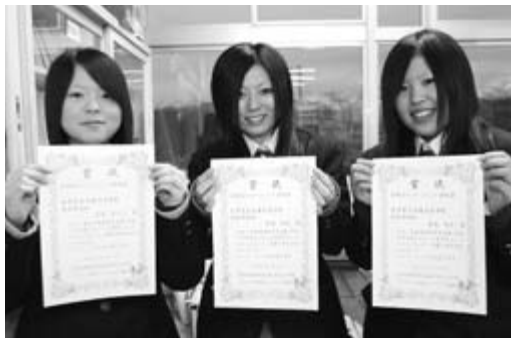
晴れの受賞に笑顔の商業研究部の皆さん

大東高校商業研究部は、起業教育の一環として東北経済産業局が主催した本年度「スクール発明王コンテスト」で、大賞に次ぐ特別賞を受賞しました。 市の「若者が主役の地域おこし事業」の補助を受け、同部が企画、運営の中心となって昨年7月に行われた「いちのせき高校生チャレンジフェスタ2007」について、顧客満足度に注目し、行政や産業界、マスコミなどの連携を重視した点、市内の