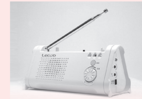
☎広聴広報課 ☎ 8182