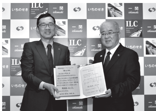
木製の盾は市内産のスギを使用