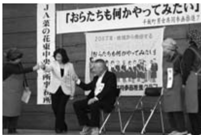
オリジナルの分かりやすい寸劇を中心として男女共同参画への理解向上に取り組んだ千厩地域男女共同参画推進クラブの皆さん