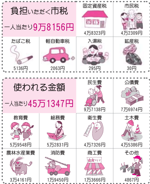
図3 ■市民一人当たりで見た一般会計の予算