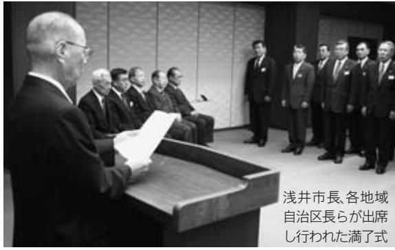
浅井市長、各 地域自治区長ら が出席し行われ た満了式