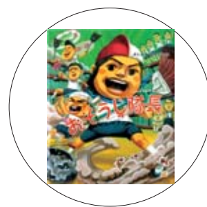
「おそうじ隊長」 よしながこうたく 作

「今年のパレタインこそ…」と思っているあなたへ。超簡単だけど、おいしくてオシャレな、彼にも友達にもちょこっと自慢できるチョコレートのお菓子レシピがいっぱい。かわいいラッピングのアイデアも満載です。