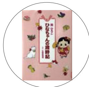
「ひなちゃんの歳時記」 南ひろこ 著

子どもに季節の行事の意味についてわかりやすく説明できますか。旧暦と新暦の違いから、毎月の主要な行事まで、日本の豊かな自然と季節、そして神様とのつながり…。どの年代でも楽しめるよう文章にはすべて「よみがな」がついています。温かいコタツの中で日本の四季を感じてみませんか。