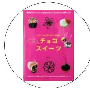
「ヤミーさんのチョコスイーツ」 ヤミー 著

子どもに季節の行事の意味についてわかりやすく説明できますか。旧暦と新暦の違いから、毎月の主要な行事まで、日本の豊かな自然と季節、そして神様とのつながり…。どの年代でも楽しめるよう文章にはすべて「よみがな」がついています。温かいコタツの中で日本の四季を感じてみませんか。