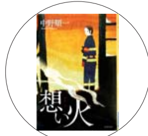
『想い火』 中野順一 編

放火事件をきっかけに火災原因調査員になった茜。ある日、尊敬する上司が放火の犠牲となる事件が。自分の手で放火犯を捕まえたい茜は、捜査権を武器に嫌がらせをする警察とぶつかりながら、ついに「弔い」の調査を始める! サントリーミステリー大賞受賞作家の会心作です。