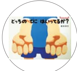
『どっちのてにはいってるか?』 新井洋行 著

放火事件をきっかけに火災原因調査員になった茜。ある日、尊敬する上司が放火の犠牲となる事件が。自分の手で放火犯を捕まえたい茜は、捜査権を武器に嫌がらせをする警察とぶつかりながら、ついに「弔い」の調査を始める! サントリーミステリー大賞受賞作家の会心作です。