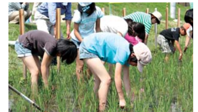
自分が植えた稲の草取りを夢中になって作業する参加者