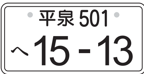
平泉ナンバーイメージ

の効果をあげています。また、東日本大震災からの復旧・復興にも大きく寄与すると考えています。