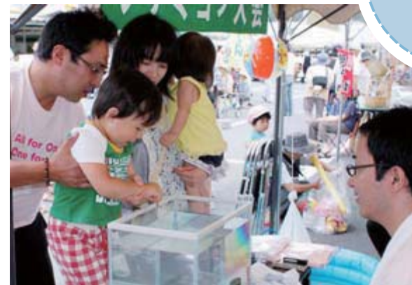
ずらりと並んだ出店で買い物やイベントを楽しみました