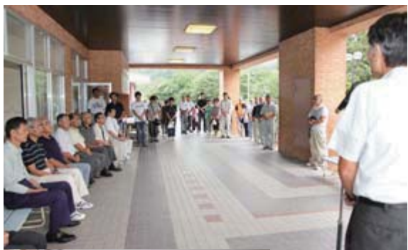
避難所閉鎖式 小泉地区の人たちが出席した

同地区の人たちは、震災が被災した当初は気仙沼市小泉中学校に避難していましたが、入浴など避難所の環境をよりよくするため、4月17日から室根町の旧津谷川小学校に移りました。津谷川地区と小泉地区はサケの放流を通じた交流を約20年にわたり続けてお