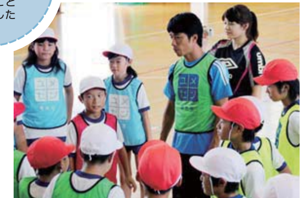
仲間と協力することの大切さを学んだ摺沢小5年生

残暑の厳しい中、地域社会の重要なコミュニケーションの場でもある商店街ににぎわいを創出するとともに消費者の方々へ感謝しようとずらりと出店が立ち並び、にぎわいを見せていました。14回目の今年はアイスクャンディーの早食い大会、よさこい演舞、歌謡漫談ショーなどが繰り広げられ、訪れた観客を魅了し、祭りは大いに盛り上がりました。