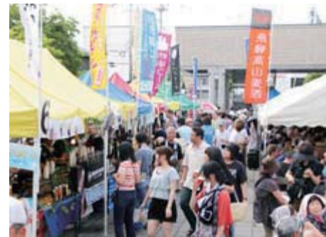
上/気の合う仲間同士が笑顔で乾杯 左/全国の地ビールがずらりと並び、大勢の人たちでにぎわいました。