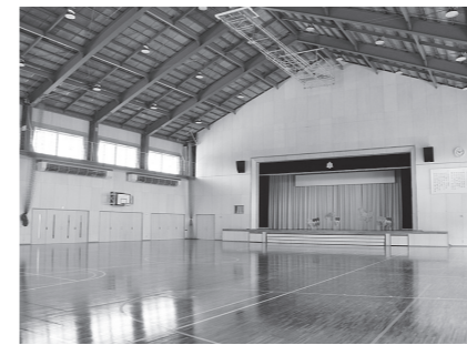
天井が高く広々とした体育館