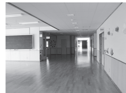
明るい雰囲気のある廊下