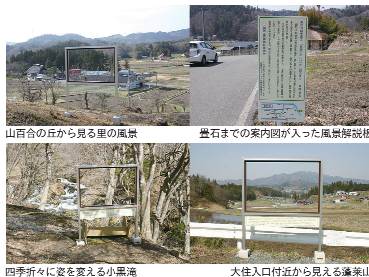
山百合の丘から見る里の風景

2013年5月1日号/発行 一関市/編集 大東安所地域振興課/T029-0711 一関市大東町大原字川内40 ☎0191-72-2111 /ホムペ: http://www.city.ichinoseki.iwate.jp /印刷 株式会社日新印刷