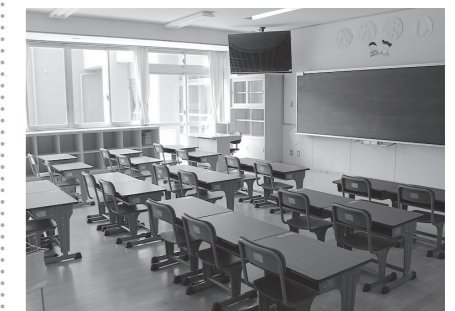
全学年2組ずつの教室