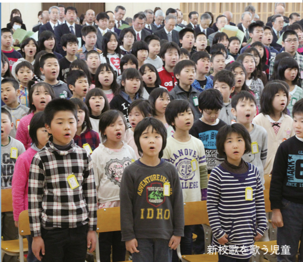
新校歌を歌う児童