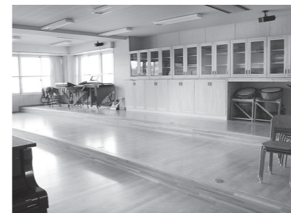
ステージのある音楽室