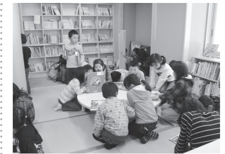
図書室には畳敷きのスペースがあり、休み時間になるとみんなが集まってきます