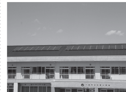
校舎の屋根に取り付けられたソーラーパネル