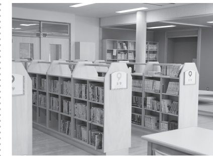
開放的で整然とした明るい図書室