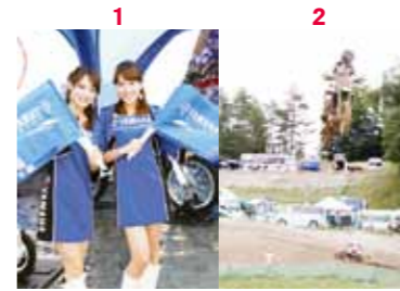
1 大会に彩りを添えるYAMAHAのキャンペーンガール/2 ジャンプは見所の一つ。マシンごと宙に舞うテールトップ/3 頂点目指して、全車が一斉にスタートを切る/4 勝利を祝うチャンパンシャワーと大勢のモータースポーツファン