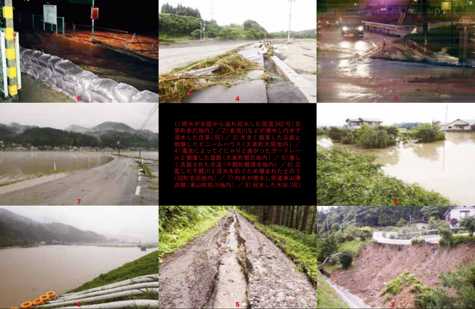
1) 雨水が水路から溢れ冠水した国道342号(花泉町金沢地内) / 2) 金流川などが増水し内水で浸水した住家(同) / 3) 大きく崩落した法面と倒壊したビニールハウス(大東町大原地内) / 4) 濁流によってぐにやりと曲がったガードレールと損壊した道路(大東町摺沢地内) / 5) 激しく洗掘された市道(千厩町磐清水地内) / 6) 氾濫した千厩川と浸水を防ぐため積まれた土のう(同町宮田地内) / 7) 内水が増水し県道東山薄衣線(東山町松川地内) / 8) 冠水した水田(同)

日本海上空に寒気を伴った低気圧が停滞。低気圧に向かって暖かく湿った空気が流れ込み天気は不安定に。市全域が豪雨にみまわれた。(写真：東山町松川地区)