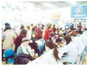
毎年2月に開かれる「いちのせき健康まつり」での「くすりのなんでも相談」。「体脂肪率測定」とならんで大好評のコーナー。

者の在宅医療などの相談にも応じています。そのため、毎月2回ほど、さまざまな分野の専門家を迎えて研修会を行っています。