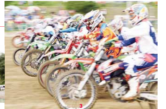
1 大会に彩りを添えるYAMAHAのキャンペーンガール/2 ジャンプは見所の一つ。マシンごと宙に舞うテールトップ/3 頂点目指して、全車が一斉にスタートを切る/4 勝利を祝うチャンパンシャワーと大勢のモータースポーツファン