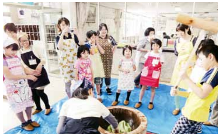
6月に行われた親子体験スクール「ヨモギモチ作り」

千厩公民館は、1970年の岩手国体開催に向けて、69年、千厩体育館と一緒に建設されました。当時は「千厩町福祉会館」の名称で親しまれていました。 千厩地域では千厩、小梨、奥玉、磐清水各地区の4公民館合同の市民講座「せんまや里山塾」を開いています。誰でも、どの公民館の事業にも参加でき、本公民館の▼ウォーキングを主体とした「健康づくり講座」▼地域の古文書を解説して歴史をひも解く「歴史講座」の2講座もとても好評です。自