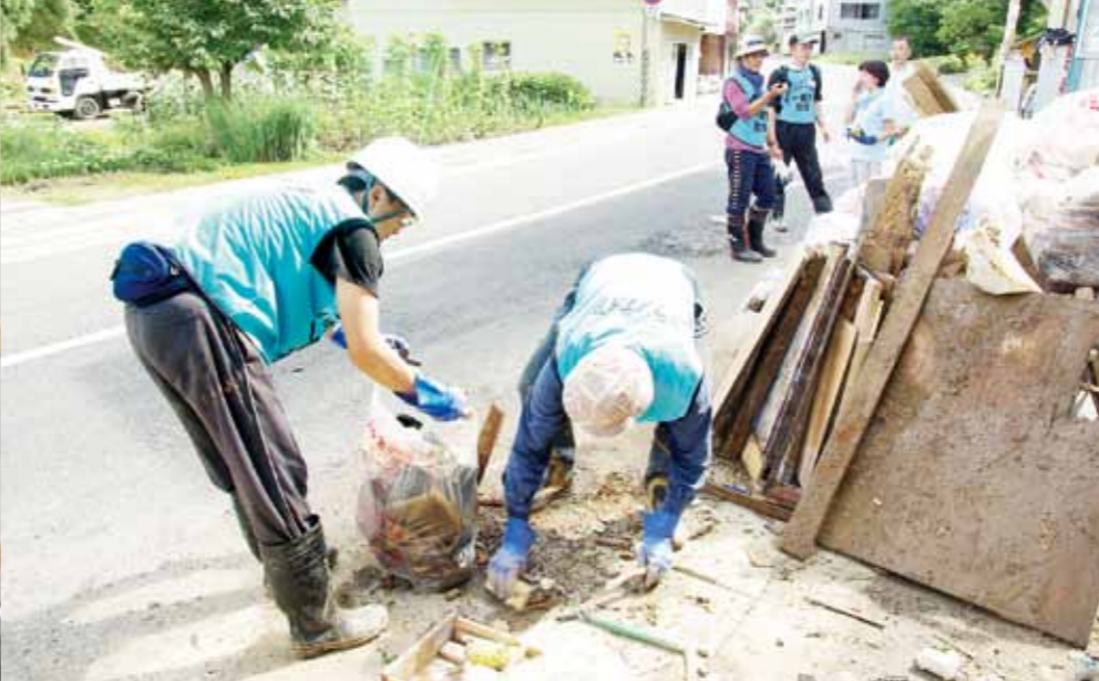
ごみ拾いなどの作業をするボランティアスタッフ。真剣な作業ぶりに地域住民は感謝していた