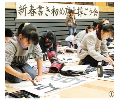
①真剣なまなざしで揮毫する子どもたち お手本を見ながら何度も練習しました