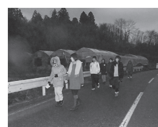
元旦から元気に歩く参加者たち(左=永井地区、右=日形地区)

また、日形地区元旦歩け歩け大会(日形まつり実行委員会など主催)も開かれ、子どもからお年寄りまで約100人が参加して3キロの日形路を歩きました。このほか、涌津や金沢地区でも各集落公民館が主催し神社などへ初詣するなど、ウォーキングで汗を流し健康増進と地区民交流を図りました。