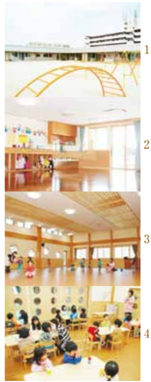
1 2 3 4