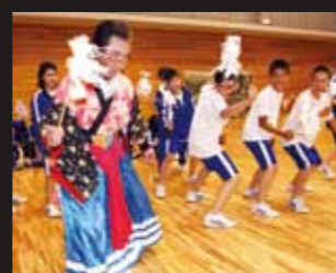
生き生きと舞う八木山中の生徒たち

太鼓や鉦の音、躍動感あふれる舞。独特のせりふによって物語が進行する南部神楽は、さながら和製オペラ。 舞い手は「一の谷」や「五條の橋」をはじめとする源平合戦や「曾我兄弟の仇討ち」「信田妻」などの物語を揚々とした声で描いていく。また、演目によって、派手な立ち回りと細かな仕草を使い分ける。はやし手はリズムミカルな太鼓や鉦、神楽歌で舞い手を引き立てる。舞台裏を支えるスタッフの演出も見逃せない。 舞い手が物語の終わりを告げると、客席から大きな拍手が送られる。身近な地域で得られる一体感。これこそが神楽の魅力ではないだろうか。