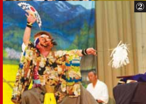
①_翁 ②_荒形 ③_幣束や面などの小物 ④_女形 ⑤_若人