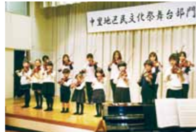
地区民文化祭では様々な世代が日々の練習の成果を発表します