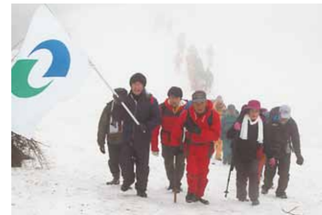
雪渓を踏みしめながら頂上を目指す登山者