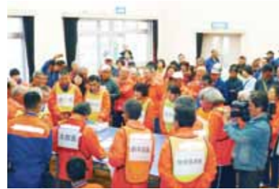
公民館を中心に、地域コミュニティの強化に取り組みました