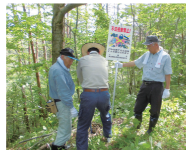
看板を立てる参加者