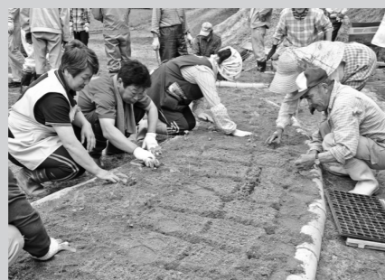
手際よく苗を植える参加者

東山地域では、6月上旬に平成26年度花いっぱい運動の花苗を各自治会などに配布、最も大きな花壇を作っている竹沢集落では、6月15日集落みんなで苗植えを行いました。市民憲章推進協議会から配布されたサルビアとマリーゴールドの苗約2,000本の他に、集落で用意した約5,000本の花苗を、約60人の参加者が慣れた手つきで手際よく植え付けていました。花壇は「ILC」の文字をかたどるなど思考を凝らしており、8月上旬頃から、7,000本の花が咲き見頃を迎えます。