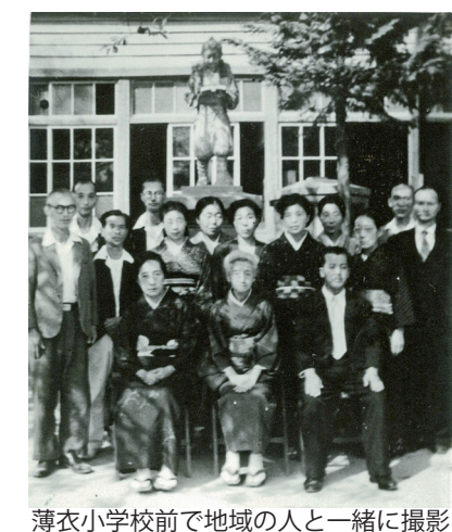
薄衣小学校前で地域の人と一緒に撮影