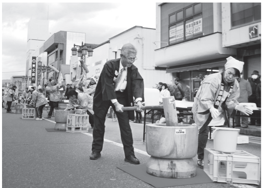
商店街には、前回は上回る40基の白が並べられた

小野幹/著 河出書房新社/発行 著者は藤沢町出身。アサヒカメラ年度賞最高作家賞をはじめ、多数入賞しています。現在も、仙台の情報誌「りらく」で写真を連載中です。本書には、母親の洗濯を手伝ったり、スキーをしたり一東北の生き生きとした子どもたちの写真を掲載。一関の様子も載っています。昭和のたくましさや懐かしさを感じる一冊です。