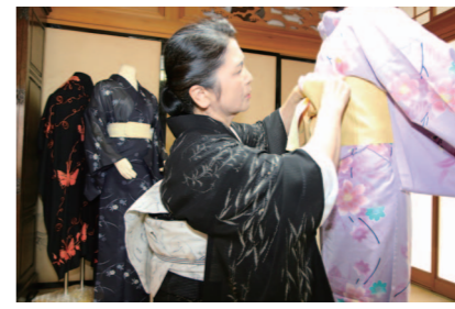
浴衣の着付けにかかる時間は1人30分程度