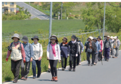
千歳大学のウォーキング講座。参加者は約50人の道のりを歩いて心地よい汗を流した

狐禅寺市民センターは市役所本庁から東へ約6kmに位置し、同敷地には狐禅寺幼稚園があります。近くには県立磐井病院や県立南光病院などがあります。 建物は1977年4月、狐禅寺小学校校舎跡地に建て替えて開館しました。 その後、99年8月にバスケットボールコート1面分の広さの体育館を増設。地域団体のスポーツ活動に利用されています。 最近では、地域外のスポーツ団体やスポーツ少年団の利用も多く、バスケットボ