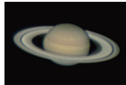
室根町折壁の「天文台ひろ」で撮影した土星