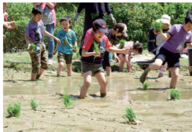
「狐禅寺子屋」の農業体験。参加した子供たちが実習田で田植えを楽しんだ