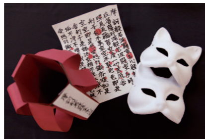
作り込んだ小道具が怪談を盛り上げる