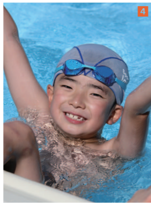
1_室根町折壁で撮影した星空。天の川や夏の三大角形（はくちょう座デネブ、こと座ベガ、わし座アルタイル）など、あまたの星々が輝く／2_花泉町油島では、里山の自然を調べ続けている／3_舞川地内「遊水地展望台」からの眺望。眼下に広がる鮮やかな夕暮れ／4_涼を求め、児童・生徒が集まる一閑水泳プール／5_トマト、ナス、キュウリ、ピーマン、ミニトマトは一閑を代表する夏の野菜／6_大東町鳥海の「小黑滝」。重なり合った大岩石を流れ落ちる水の白さに注目／7_藤沢町徳田地内には真夏の太陽を浴びたヒマワリが並ぶ／8_夏の風物詩、線香花火。火葉のにおいは思い出を呼び覚ます／9_地主町の「浦しま公園」は、静かな庭園でゆったりとした時間を過ごせる