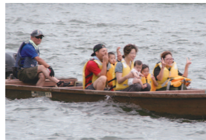
ボートやカヌーで川の流れをじかに感じられる