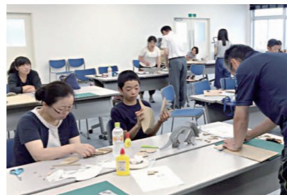
体験の一番人気はダンボールアート