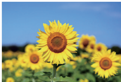
ヒマワリの名は太陽を追うように動くことに由来