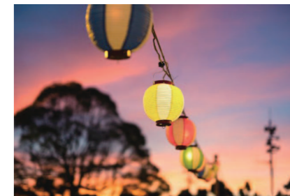
大人も子供も祭りばやしに心が躍る