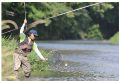
砂鉄川では9月中旬までアユ釣りが楽しめる