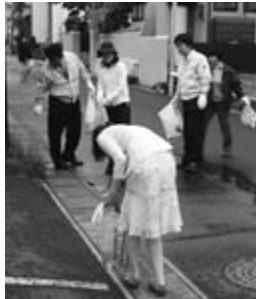
朝夕、ポイ捨てごみや犬のふんを拾いました

より快適なまちをみんなでつくっていくこととするものです。 事業の呼び掛けを兼ねて6月1日、市と県南広域振興局一関総合支局の職員によるごみ清掃ボランティアを市内全域で実施。約1200人が、午前7時30分から午後5時30分までに分かれ、道端のポイ捨てごみや犬のふんを拾って歩きました。