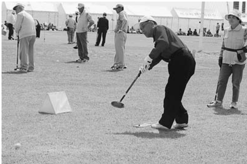
青空の下、ホールインワン目指してナイスショット!

を通じてさらなる市民の交流と一体感の醸成を図るため、7地域で7種目の競技を行う「市民交流スポーツ大会」を開催することとし、その最初の競技としてこの日、グラウンドゴルフ競技が行われたものです。