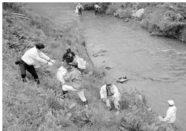
5月13日、「千厩川をホテルの飛び交うきれいな川に」と約100人が参加して行われた「第10回千厩川元気再生大作戦」