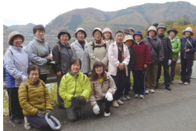
ウォーキング講座で秋の錦秋湖へ移動研修した際の参加者

大原市民センターは昭和23年に開館。54年に旧大原小学校の建物があった場所に移転し、現在まで、大原地区の拠点として多くの人に利用されています。 大原地区には2つの大きな祭りがあります。一つ目は「大原だるま祭り」。数え年で20歳の若者が実行委員会を立ち上げ、だるまの製作、寄付集めなど祭りの一切の運営を親の会と共に実施。8月15日に、数え年で20歳の若者がだるまを、小学6年生の児童が小だるまを担いで商店街を練り歩き、