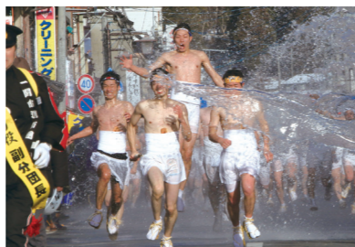
「一関市・大東大原水かけ祭り」で水しぶきの中、商店街を疾走する裸男