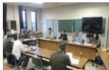
生母地区で行われた打ち合わせの様子

①対象者：5人以上の団体 / ②助成内容：東稲山麓地域の活性化に向けた、新たな取り組みの経費(イベントの開催費用は対象外)。上限は10万円