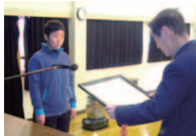
全国大会で活躍した 萩荘の児童生徒らに「萩荘まちづくり 栄誉賞」を贈る

萩荘市民センターは「夢と希望のまち萩の庄」の実現を目指しています。地区民一人一人が主役のまちづくりを実現のため、今年4月1日から「萩荘地区まちづくり協議会」による指定管理施設になりました。指定管理の開始を記念した「スペシャルマジックショー」は7月1日、萩荘小で開かれ、多くの地区民にぎわいました。