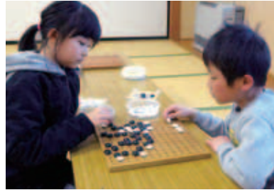
「学びの土曜塾」として開かれている 囲碁教室