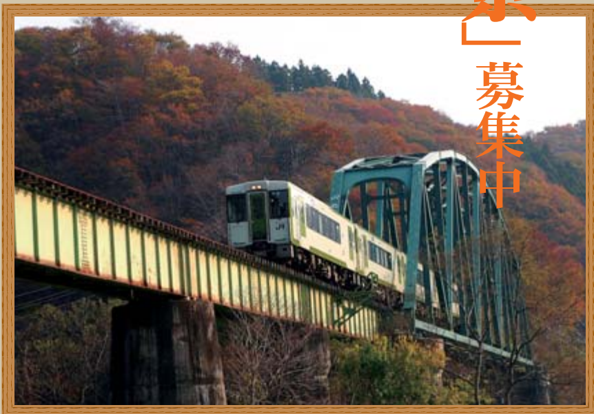
J R 大船渡線横石鉄橋(一関・川崎)