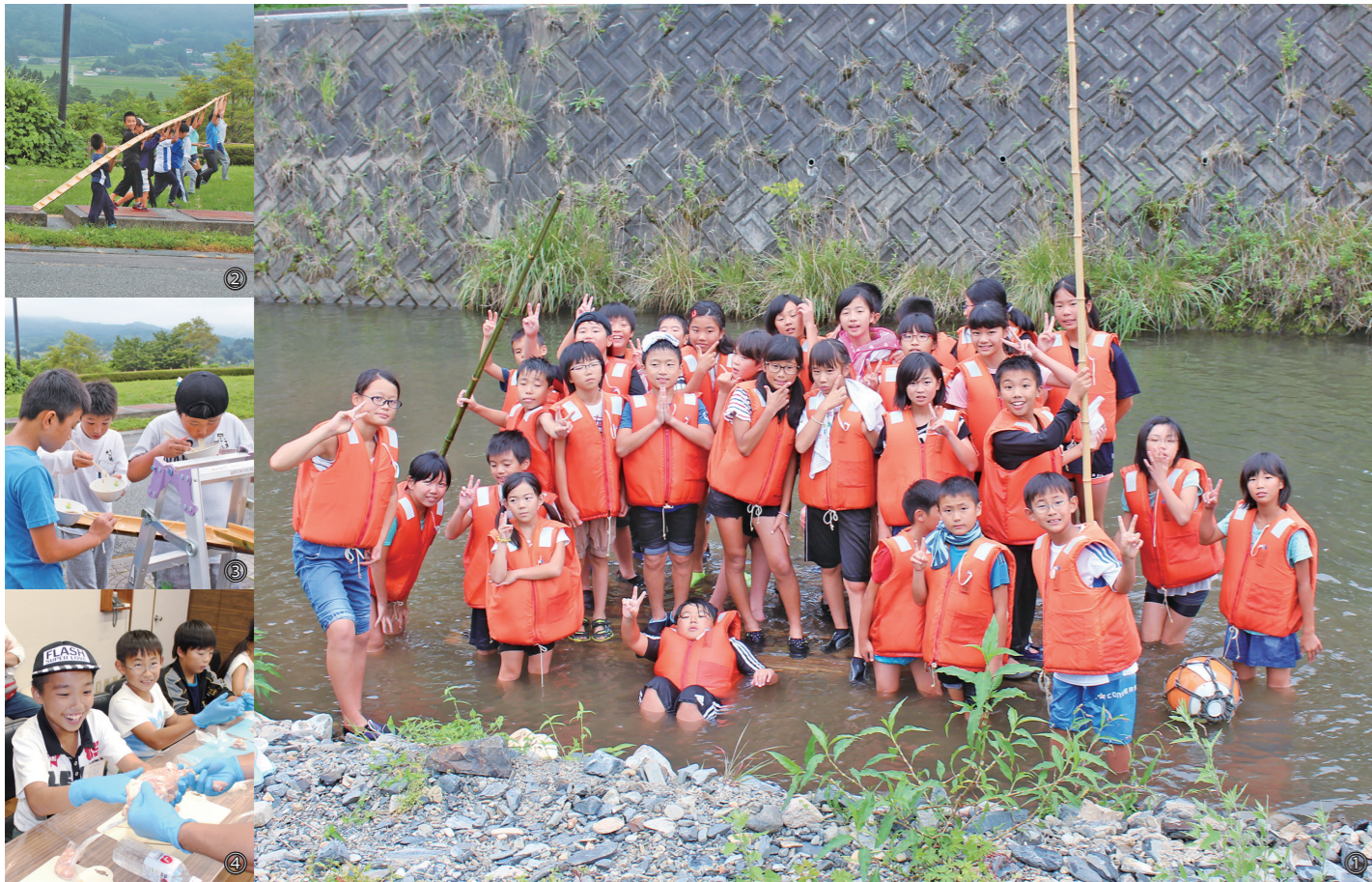
①津谷川でいかだ体験 ②③流しそうめん ④焼き鳥の串刺し体験