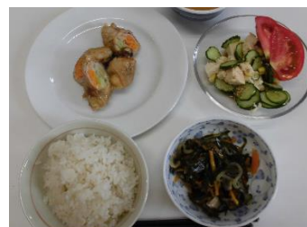
養成講座 『ロコモ予防筋力 アップメニュー』