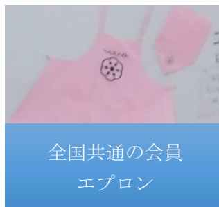
全国共通の会員 エプロン