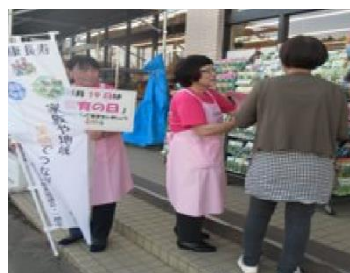
『食育の日（毎月 19 日）』 店頭 PR 活動