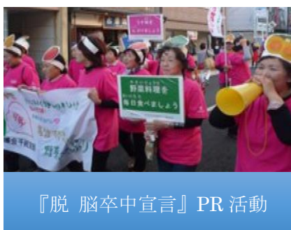
『脱 脳卒中宣言』PR 活動