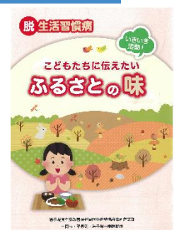
両磐の地域行事食冊子作成