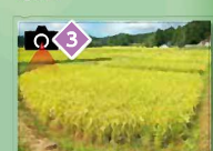
昔ながらの小さな田んぼが見られます。