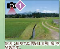
絵図に描かれた栗駒山(須川岳)を望みます。