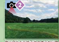
奥に見える若神子社の木立が印象的です。