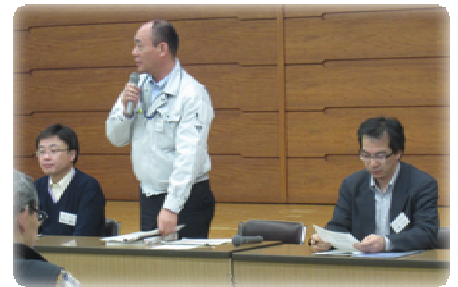
事務局による、第1回で寄せられた「専門的質問に対する回答」

この作業は、前回の色別のグループメンバーをシャッフルして、新たなグループメンバーを構成して行いました。第2回目からの参加者も含めて、「A」、「B・C」、「D」、「E」の4グループで、活発にそして和やかに自分が検討して行きたいテーマを出し合いました。