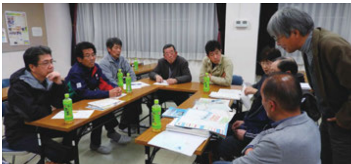
災害対策の意見を交わす安全安心部会

砂鉄川は地域を縦断しており、当地域は平成14年7月、平成25年7月の水害をはじめ、多くの災害を経験しました。