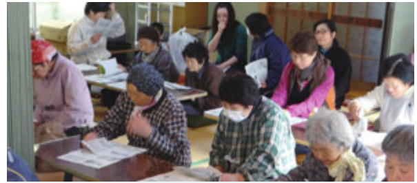
介護予防について学習する参加者