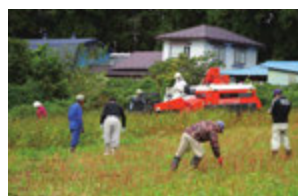
そばの刈り取り作業

特産品開発チームでは、遊休農地にそばを栽培し刈り取りから製粉、そば打ちまで行っています。年越しそばの販売や文化祭、各地のサロンや福祉施設等に出向いてのそば打ちなど、打ち立てのそばの美味しさを広めています。