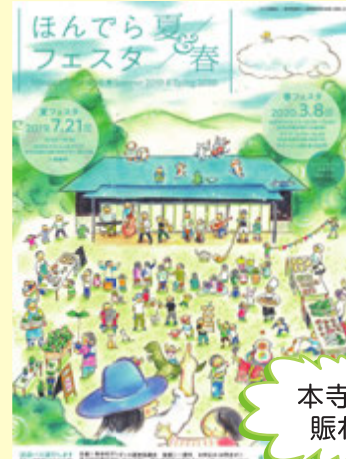
本寺に元気と 賑わいを!

夏(入場無料)と春に行われるイベントは、地元と市内外の多くの方々、幅広い年齢層の方々が楽しく交流できる場となっています。お気軽にお越しください。詳しくはこちら↓