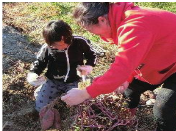
サツマイモ収穫の様子