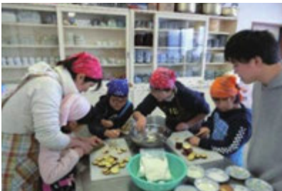
収穫したサツマイモで料理中

農村地域の「干し文化」に注目。サツマイモの栽培から収穫までを地域の子供たちと一緒にに行い、最終回は干しイモやスイートポテトなどの様々なサツマイモ料理で収穫祭をしました。課題は中心メンバーの増員です。地域の難題を「おいしい」に変換する力を持つ若者たちを支えていきたいと思っています。