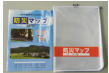
完成した防災マップ

当会の安全安心部会で、「災害時に適切に行動できるように松川独自の防災マップが欲しい」との意見が出され、一関市の防災マップを基に、部会員が各行政区内の治山ダムや砂防ダムの場所を調査し、消火栓や防火水槽を加える等1年かけてマップを作製。この防災マップをきっかけに家族での話し合いや地域での学習などに役立ててもらいたいです。