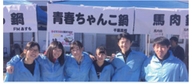
「新町鍋フェスタ」に参加した千厩高校の生徒

「若い人が地域で活躍する場が必要では？」とワークショップで出された課題から、高校生の地域参加等を促進するため「夏の千仰祭」や「新町鍋フェスタ」への出店等を高校生と協働で事業実施。生徒自身が企画・運営を担い積極的に取り組んでいます。今後も若い世代がより地域で活躍できるようサポートをしていきます。