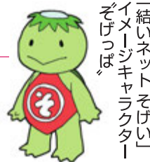
「結いネットそげい」イメージキャラクター「そげっば」

曾慶 PRチームでは平成29年度に「結いネット そげい」のイメージキャラクターと愛称を募集。曾慶カッパ伝説を元にしたキャラクター「そげっば」が誕生しました。