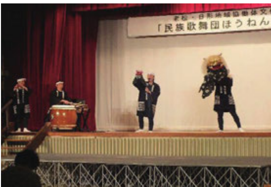
ほうねん座の獅子舞パフォーマンス

「本物を見たり体験して感動する心は、きっと人づくり、地域づくりにつながる」との思いで取り組んでいる文化事業。平成30年度は、地域住民から募った委員と地域の文化団体推薦の委員、老松・日形両地区の地域協働体で実行委員会を組織。仙台市の秋保地区を拠点に活躍する民族歌舞団ほうねん座の公演を開催しました。たくさんのお客様に会場にいらしていただき、迫力満点のパフォーマンスに大きな拍手が送られました。オープニングアクトでは老松小学校児童や地元太鼓団体の演奏も披露され、各団体のこれからの活動に寄与できる事業となりました。