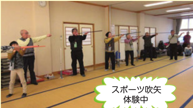
スポーツ吹矢 体験中

現在、新たな事業を検討しています。これからも、みんなで楽しめる地域づくり活動を実践していきます。