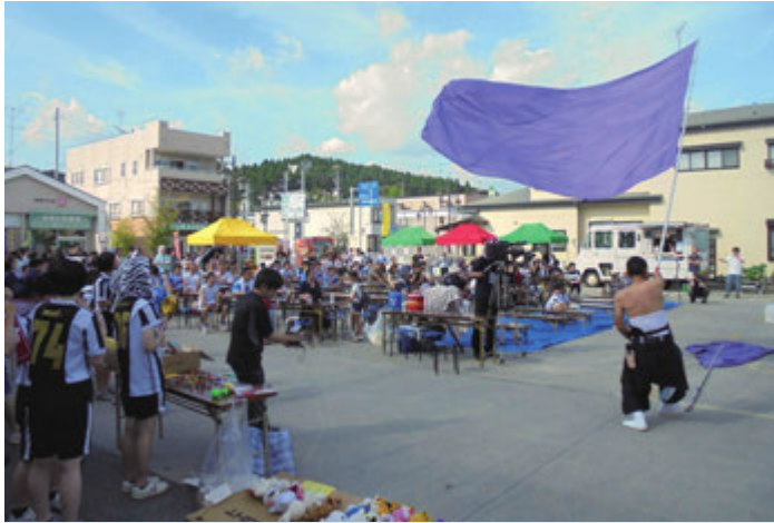
高校生との協働事業のイベント『夏の千仰祭』

当協議会は、「住んでみたいと思える地域づくり」を目的に、地区内自治会、各団体等の方々により平成17年8月9日に設立。「健康で笑顔あふれる地域を次世代へ」をスローガンに、地域づくりに取り組んでいます。