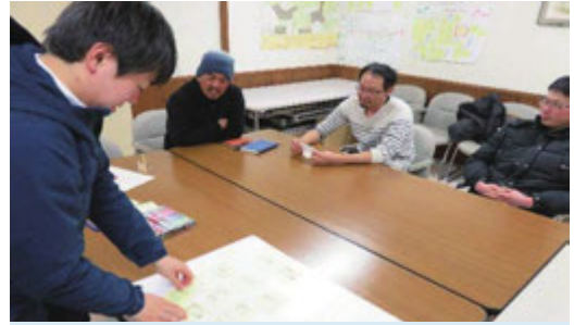
ミーティング風景

老松市民センターでは、若者の力を発揮するきっかけづくりとして平成28年に「老松若者ミーティング」と称するミーティングの機会を作りました。各集落からの推薦で集まったメンバーも、現在は有志数人となり、名称も「老松をおいしく志隊」に変更。平成30年度は老松市民センター事業「学びの土曜塾」と共催し、「おいしい地域おこしサツマイモ☆チャレンジ」を4回開催しました。