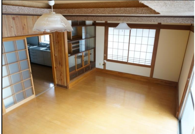
▲物件外観 ▼室内（リビング） ▲間取図 ▼案内図