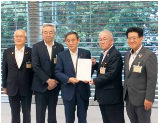
菅官房長官に要望書を手渡す東北市長会会員の各市市長 左から大船渡市長、気仙沼市長、一関市長、奥州市長