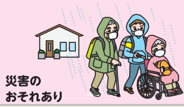
災害の おそれあり