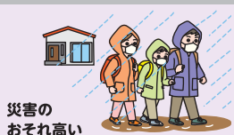
災害の おそれ高い