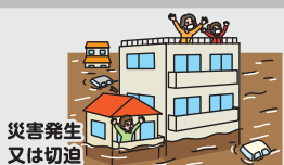
災害発生 又は切迫