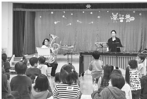
演奏に合わせて歌や踊りを楽しむ園児たち

誰もが知っているアニメの歌やクラシックを中心に構成され、アニメ・忍たま乱太郎の主題歌「勇気100%」の演奏が始まると、園児たちは一斉に立ち上がり、大きな声で歌ったり踊ったりしながら音楽を体感していました。