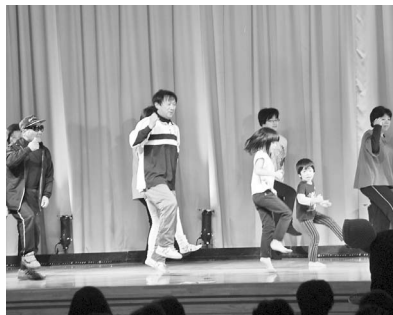
「U.S.A」の曲に合わせて踊りを披露

曾慶地区芸能祭(実行委員会主催)は11月25日、大東曾慶地区センターで開かれました。地区民の親睦と交流の場、芸能文化の向上を目指して毎年開催しているもので、今年で33回目。各サークルが日頃の練習の成果を披露するほか、毎年自治会ごとに趣向を凝らした演目で盛り上がります。オープニングは曾慶保育園5歳児による踊り「KAGUYA」で元気な踊りを披露。13区部落会館では大人から子供まで参加し、今年大ヒットしたDA PUNPの曲「U.S.A」をリズムに乗って踊り切ると、会場は大きな拍手と歓声に包まれました。