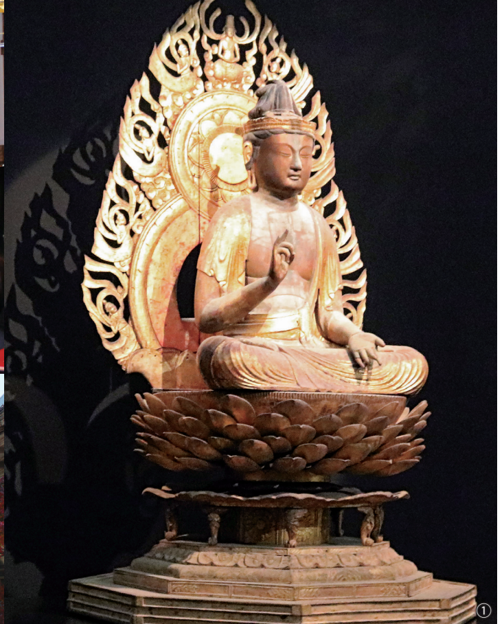
①木造観音菩薩坐像 ②畠山篤雄文化財調査研究員による記念講演 ③観音菩薩坐像が所蔵されている観音堂