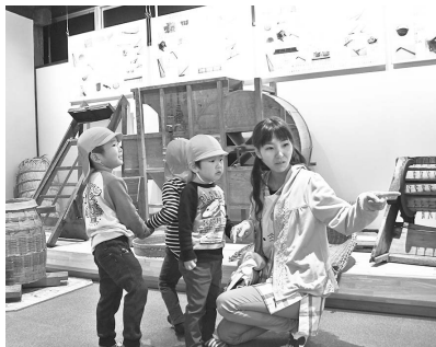
昔の暮らしに触れる園児たち

旧渋民小学校2階に整備していた「一関市民俗資料館」は11月1日、開館しました。昭和30年代の「磐井の暮らし」をテーマに昔の道具や農具などを展示。農家の四季として作業で使う農具の展示や、一年の暮らしと行事、山辺と川辺の暮らしなど、コーナー毎に紹介。また、展示ホールには、実際に使用されていた全長5.5メートルの木船、鹿踊りや伊勢神楽の衣装が展示