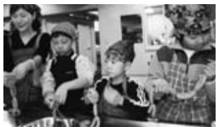
春に行われた一関おもしろ館

◇日時：9月21日(日)10:00～16:00 ◇会場：道の駅「蔵美溪」 ◇内容：市内特産品業者による特産品づくり体験および特産品販売 ◇体験内容・料金・定員：▶手焼きせんべい・100円・100人 ▶ソーセージ・500円・20人 ▶お菓子作り・300円・10人 ▶陶器づくり・300円(粘土代別250円/100円)・20人 ▶もちつき・300円・6人(2回実施) ◎問い合わせ先：本庁 商業観光課 ☎218412