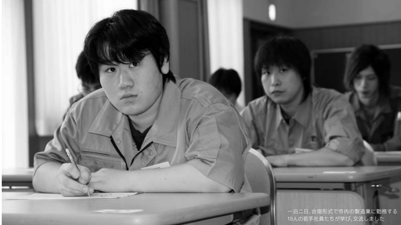
一泊二日、合宿形式で市内の製造業に勤務する19人の若手社員たちが学び、交流しました