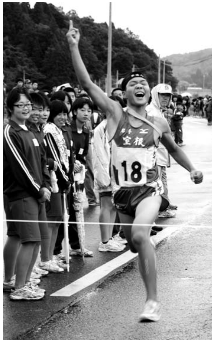
右手を高々と上げ、優勝のゴールに駆け込む室根中のアンカー

第3回一関地方中学校駅伝競走大会(一関地方中学校体育連盟ほか主催)は8月21日、千厩町奥玉地内の特設コースで行われました。 大会には、両磐地区の中学校から、6区間18校で争われる男子の部に19校、5区間12校の女子の部に20校が出場。選手たちは、垂れ込める灰色の雲から時