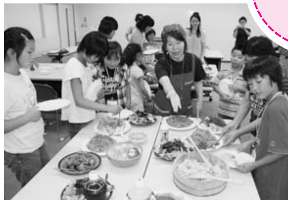
バイキング方式の夕食会で吉川市の皆さんと交流