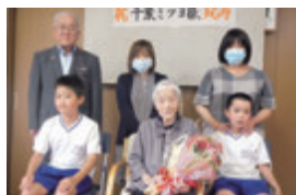
旭町 大正9年7月2日生まれ