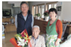
藤沢町砂子田 大正9年5月26日生まれ