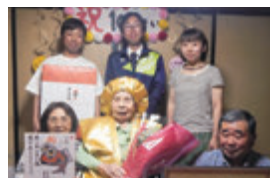
弥栄字茄子沢 大正9年5月15日生まれ