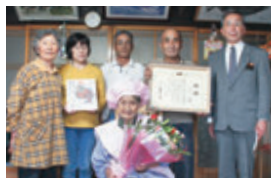
大東町大原 大正9年6月25日生まれ