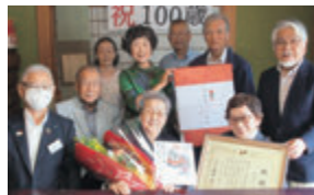
千厩町千厩 大正9年7月6日生まれ