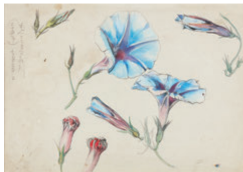
作者 白石隆一 制作年 1950年 材質、技法 紙、鉛筆、水彩