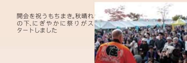
開会を祝うもちまき。秋晴れの下、にぎやかに祭りがスタートしました