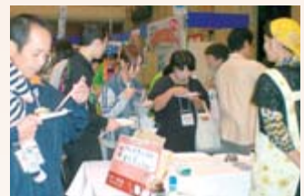
「いちのせきモッフル®コンテスト」。各店舗が工夫をこらした味を来場者が審査しました