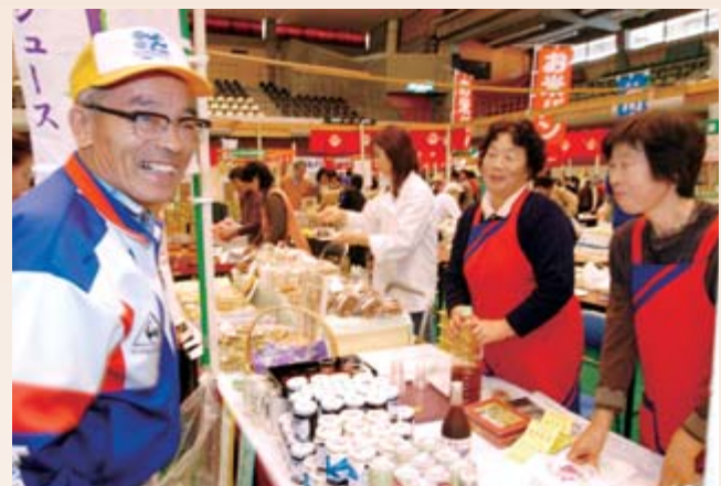
自慢の品々がずらりと並んだ販売コーナー。訪れた人たちは、試食やお店の人との会話も楽しみながら、買い物を楽しんでいました

26日には、おもちのワッフル「いちのせきモッフル®コンテスト」が行われました。一関・平泉もち街道オープンを記念して、気軽なおもちの食べ方としてメニュー開発が進められているモッフル。市内7店舗が参加し、大福、ねぎみそ、ごぼうなど多彩な味の焼きたてモッフルが供されました。来場者が試食しての投票の結果、カフェ・モンテの「スイートポテトモッフル」が1位に選ばれました。