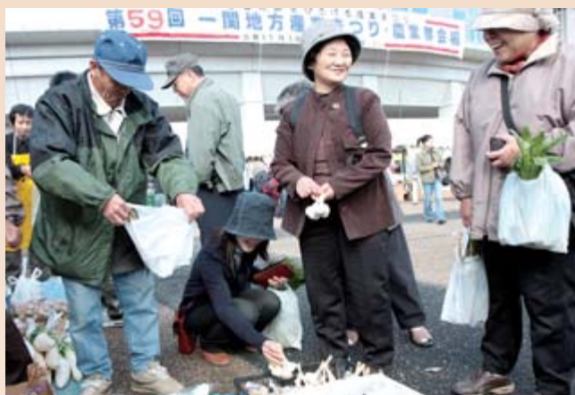
新鮮な農産物などを格安で販売するテントが立ち並び、訪れた人たちは品物を手に取り、生産者と顔を合わせながらの買い物を楽しみました