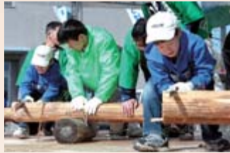
丸太切り大会。豪華賞品を目指し、のこぎりを引く手にも力が入りました