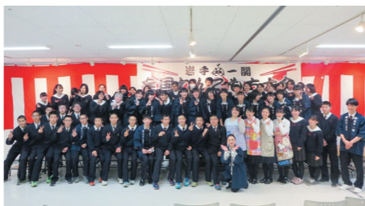
岩手一関「2020全国わんこもち大会」運営等ボランティア「一関のもち文化を世界へ発信」