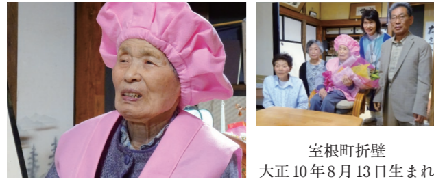
室根町折壁 大正10年8月13日生まれ