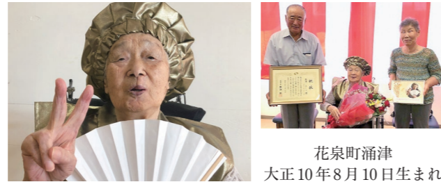
花泉町涌津 大正10年8月10日生まれ