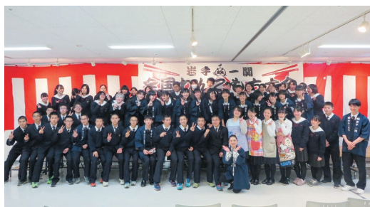
岩手一関「2020全国わんこもち大会」運営等ボランティア「一関のもち文化を世界へ発信」