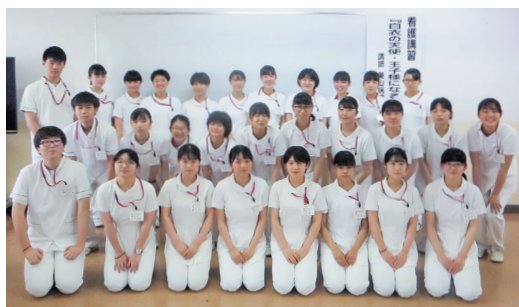
看護進学コース「未来の医療従事者たち」