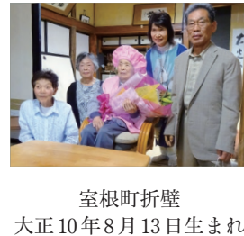
室根町折壁 大正10年8月13日生まれ