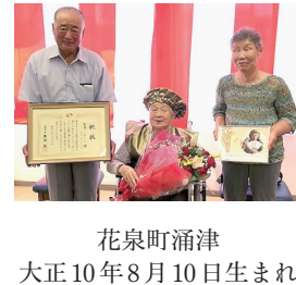
花泉町涌津 大正10年8月10日生まれ