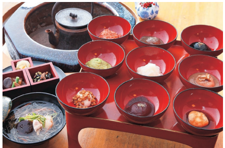
◎観光物産課 ☎28415、一関もち食推進会議 (事務局：(一社)世界遺産平泉・一関DMO) ☎345345

つく日があったといえます。季節によって種類も多彩なもち料理は、農林産物や沿岸地域からの新鮮な海産物など豊富な食材がそろう一関ならではの食文化として今も息づいています。