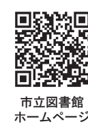
市立図書館ホームページ

◇利用方法…市立図書館ホームページの蔵書検索にログインして利用(事前にパスワード登録が必要です) ◇パスワード登録方法… ①の申込方法と共通 ●市立図書館 ☎ 2147