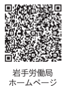
岩手労働局ホームページ

再就職や転職を目指す求職者が月10万円の生活支援の給付金を受給しながら職業訓練を受講する制度です。受講料は無料です。 *テキスト代、保険料、資格の受験料は自己負担