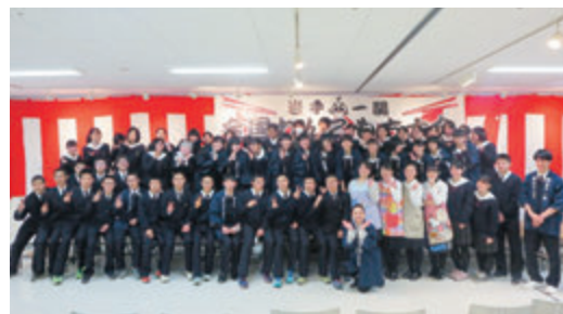
岩手一関「2020全国わんこもち大会」運営等ボランティア「一関のもち文化を世界へ発信」