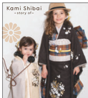
Kami Shibai -story of-