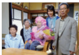
室根町折壁 大正10年8月13日生まれ