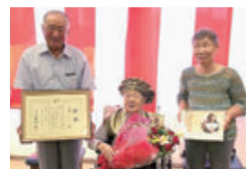
花泉町涌津 大正10年8月10日生まれ