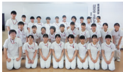
看護進学コース「未来の医療従事者たち」