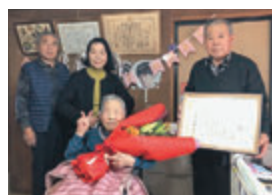
花泉町永井 大正11年12月4日生まれ