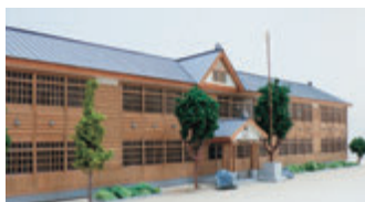
木造校舎時代の旧渋民小学校模型

本展では、本市で収蔵している懐かしの教科書や学習道具、市民学芸員と一緒に作った子供時代の生活の様子をまとめたパネルを展示します。それぞれが大切にしてきた、古里の学びの記憶を思い出しながら観覧してください。