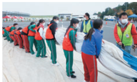
「一関・平泉バルーンフェスティバル2022」 バルーンから空気を抜き折りたたみ作業

本校ではこれからも奉仕の精神や社会貢献という言葉を大切にしていきたいと思います。