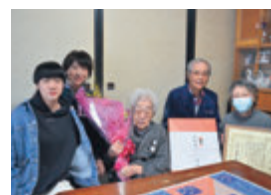
宮前町 大正11年11月6日生まれ