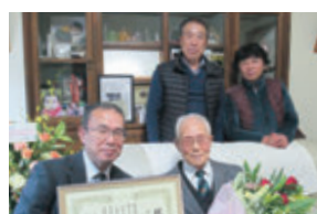
大東町大原 大正11年12月6日生まれ