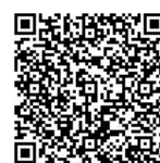
抗原定性検査 キット配布

年未年始における休日当番医の医療提供体制を確保するとともに、感染拡大を防止するため、無料で抗原定性検査キットを配布します。 詳しくは、市ホームページを確認してください。