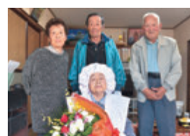
藤沢町藤沢 大正11年11月7日生まれ