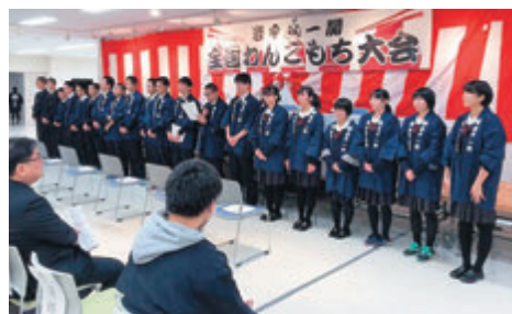
「全国わんこもち大会」 一関もち文化を継承・企画から当日運営まで