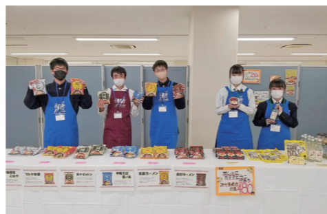
模擬株式会社DjoBによるチャレンジショップ

部活動では、ワープロ部が東北大会に出場。鹿踊部が「いわてユネスコ文化賞」を受賞しました。他の部も活発に活動しています。皆さんも大東高校で将来の可能性を広げてみませんか。