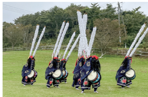
鹿踊部演舞(室根高原牧場まつり)