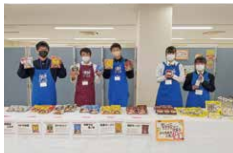
模擬株式会社DjoBによるチャレンジショップ

部活動では、ワープロ部が東北大会に出場。鹿踊部が「いわてユネスコ文化賞」を受賞しました。他の部も活発に活動しています。皆さんも大東高校で将来の可能性を広げてみませんか。