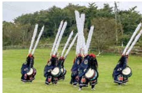
鹿踊部演舞(室根高原牧場まつり)