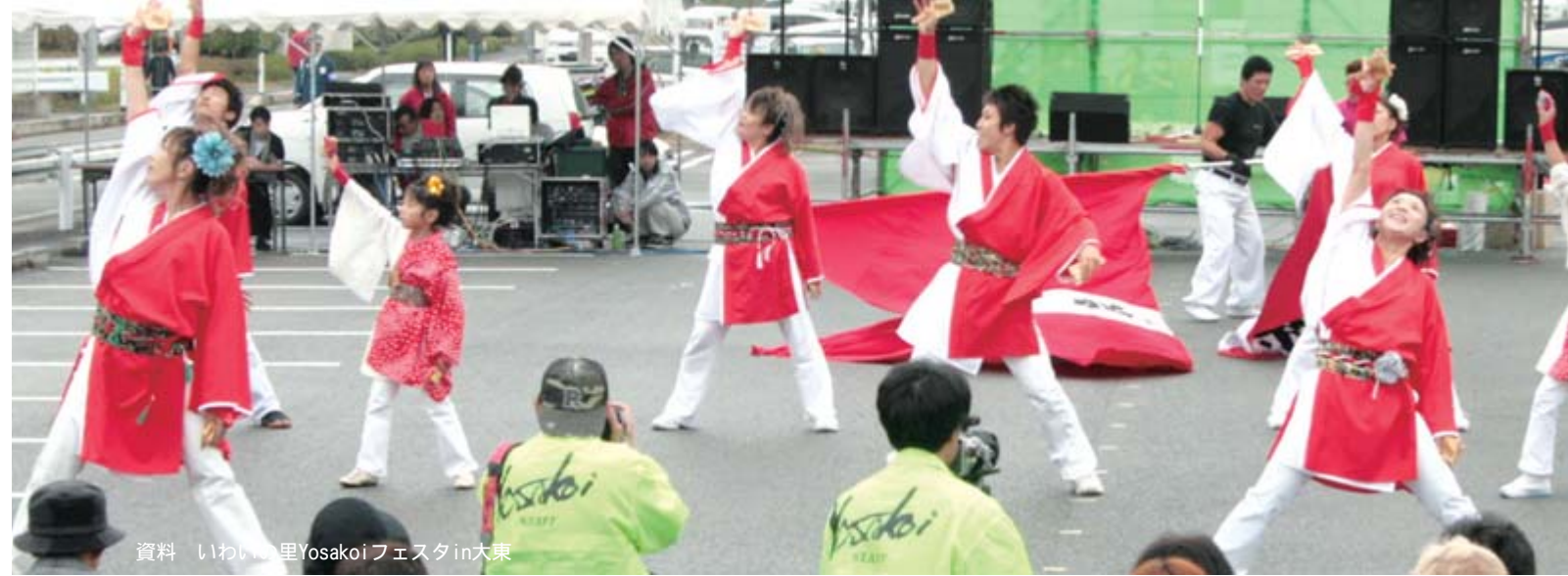
資料 いわゆる里Yosakoiフェスタ大東