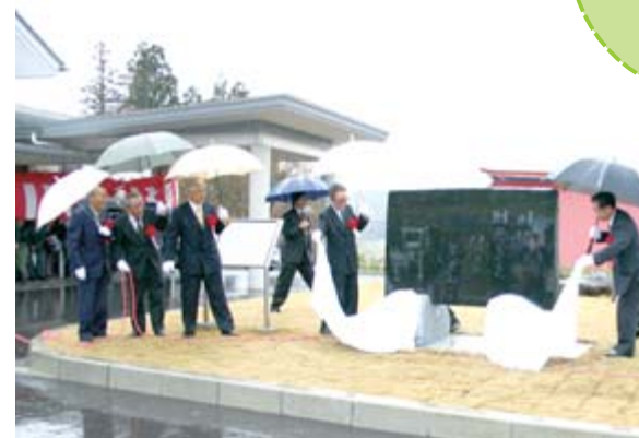
顕彰碑の完成を祝って行われた除幕式