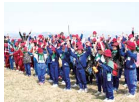
上/桜が彩る参道をわれ先にと山頂を目指す少年団員 左/山頂で眼下に広がる雄大な景色を眺めながら万歳三唱