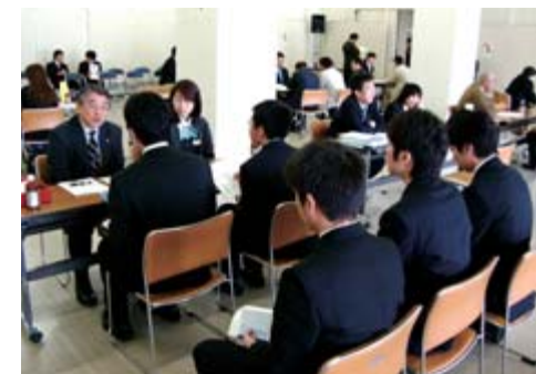
ふる里就職ガイダンスの様子

市が主催する『ふる里就職ガイダンス』は4月27日、一関文化センターで催されました。UIJターン就職希望者や地元へ帰