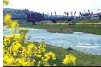
下水道 地球を守るリサイクル (日本下水道協会 21年度推進標語)

市は自然と共生する住みよい環境づくりのため、公共下水道の整備を進めています。21年度は、一関・花泉・大東・千厩・東山・川崎地域のうち下表に示した11地区で、下水管きよの延長約1万3000㍍の工事を実施します。