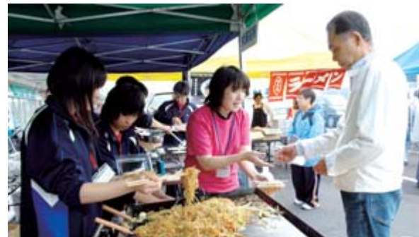
資料 いちのせき高校生チャレンジフェスタ2008

採択した事業は、地域おこし一般事業が21件、事業費1752万8千円、助成額1153万3千円。若者が主役事業が5件、