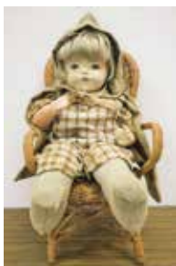
青い目の人形 ベティ (千厩小学校所蔵)

昭和2(1927)年、国際親善のためにアメリカから日本の小学校に贈られた「青い目の人形」は、太平洋戦争が始まると、敵国を象徴するものとみなされ、その多くが壊されたり焼かれたりしました。本展では、現在市内の小学校に残る計4体の「青い目の人形」を展示します。悲惨な歴史を越えて、大切に残された「青い目の人形」を通して、先人の平和への思いを知る機会になれば幸いです。