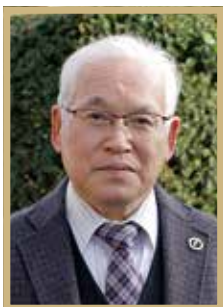
瑞宝双光章 郵政事業功労

元日本郵政公社職員・特定郵便局長。千葉県の市川郵便局で働いた後帰郷し、数局の郵便局に勤務。摺沢郵便局長は平成14年から約8年間務め、地域に根差した信頼される郵便局の運営に尽力しました。「地域の皆さんと職員のおかげで楽しく働くことができた」と感謝の気持ちを込めました。