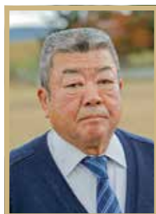
瑞宝小綬章 検察官功労

元仙台区検察庁副検事。旧国鉄での勤務後、33歳で検察事務官となり、4年後に副検事選考試験に合格。岩手、宮城両県の区検などで約26年間にわたり、市民生活に関わるあらゆる事件に向き合いました。「単身赴任が多く、支えてくれた家族には気を遣わせて」と振り返りました。