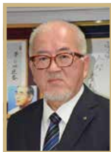
旭日小綬章 地方自治功労

前一関市長。昭和49年県庁入り。総合雇用対策局長、総合政策室長、企画理事兼県南広域振興局長などを歴任。平成21年の市長選で初当選し、「協働のまちづくり」の推進などに手腕を振るいました。「市長の3期12年が評価されたのだとすれば、非常に光栄なこと」と喜びを語りました。