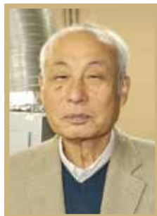
旭日単光章 生活衛生功労

岩手県興行生活衛生同業組合副理事長。大手映画会社関連企業勤務を経て、市内で唯一となった映画館を半世紀以上にわたり営んでいます。「日常生活とは異なる特別な空間を味わえるのが映画館の魅力。そういう場所を提供できるように努めていきたい」と語っています。