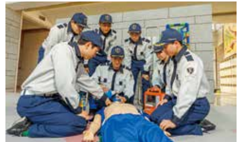
救急救命学科の授業風景

救護のサポーターとして参加。理学療法学科は介護予防事業「週イチ倶楽部もっと応援事業」(一関市主催)の一部を学校内で開催するなど、市民の皆さまとの交流活動にも力を入れています。