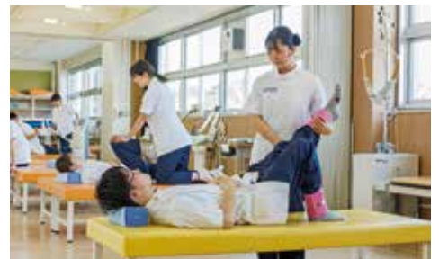
理学療法学科の授業風景

各学科では専任教員のほか、現役で活躍している医師、救急救命士、病院の理学療法士を講師に招き、現場さながらの実践的な授業を展開しています。