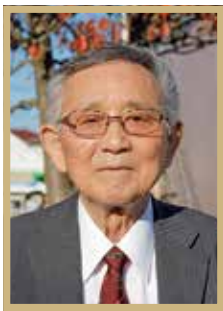
瑞宝双光章 教育・保育功労

政府は、令和5年秋の叙勲受章者を発表しました。叙勲は、国家または公共に対して功労のある人に勲章が授与されるものです。