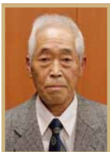
瑞宝単光章 消防功労

元一関市消防団分団長。昭和43年の入団以来、39年10カ月にわたって団員の資質向上や消防団組織の機能強化に貢献しました。自主防災組織や婦人消防協力隊と連携した防災指導にも努めました。「消防団の活動が認められたことに感謝している。受章は大変名誉なこと」と語りました。