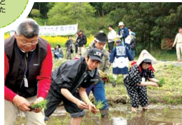
昔ながらの手植えの作業を行う参加者たち

5月22日からは、朝露に濡れたボタンを楽しんでほしいと午前5時から開園しました。朝から晴天に恵まれた22日は、早咲き、中咲きの品種が満開に。市内から訪れた男性は「露に濡れたボタンを撮影したいと来ました。黄色のボタンを撮りにまた来たい」と鮮やかに咲き誇る花を写真に収めていました。ぼたん・しゃくやく祭りは6月13日まで開催されました。