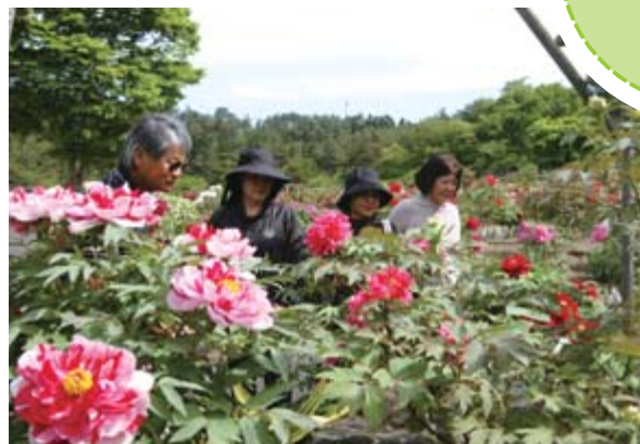
カラフルな花々に見入る来場者