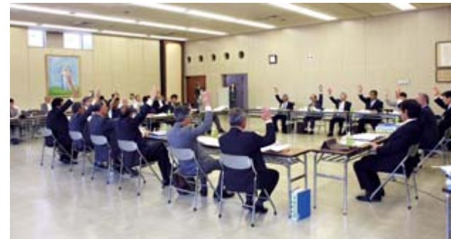
合併の方式などを決定した第5回一関市・藤沢町合併協議会

第5回一関市・藤沢町合併協議会が6月3日、市役所で開催され、合併の方式を「編入合併」とすることなどを決定しました。この日の協議では、まず前回の協議会で結論を持ち越していた「地域自治区等の設置について」を協定項目に追加することとし、合併協定項目は左表の24項目となりました。