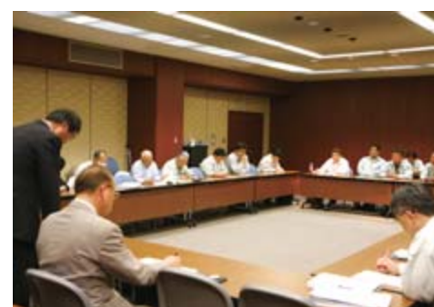
関係団体が対策を協議した連絡会議