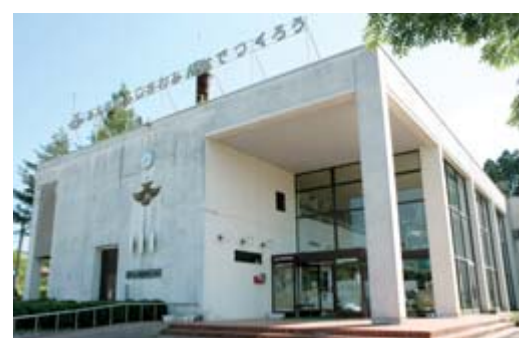
藤沢支所となる予定の藤沢町自治センター