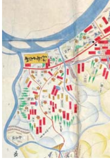
上記の一部を拡大。「中尊寺村」付近

元禄12(1699)年2月に生江助内によって描かれた、磐井郡のうち北上川西岸北部の西岩井の絵図の写しです。 村ごとに色分けされ、村の境界線は白、道は赤、川やせきは水色で彩色され、寺社・堤・田・畑・古館・一里塚・家などが図示されたカラフルな絵図です。元禄12年ごろの、地形や土地利用、家の戸数まで具体的に知ることができます。また、平