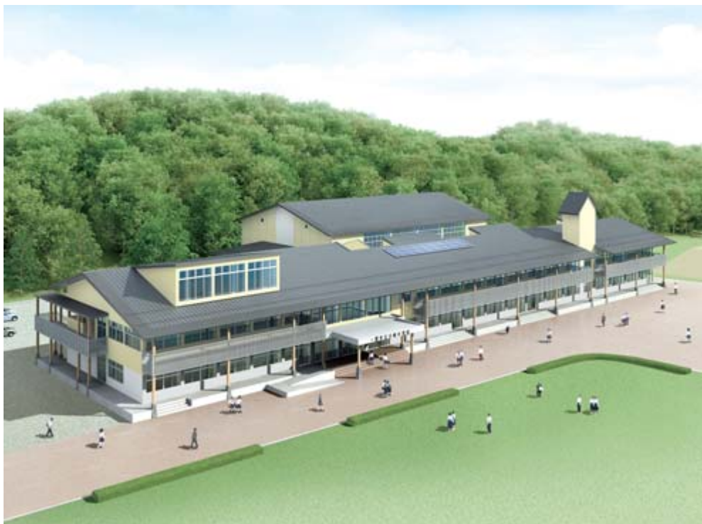
川崎中学校の完成イメージ図

増加及び岩手県市町村総合事務組合規約の一部変更の協議に関し議決を求めることについてⅡ平成22年10月1日に設置される雫石・滝沢環境組合の加入などの協議に関し、議決を求めるもの