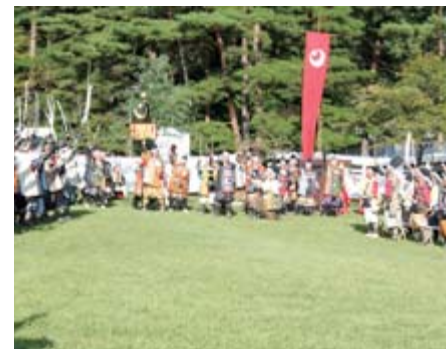
左 「エイ、エイ、オー」と全員で氣勢を上げました 下 力強く口上を読み上げる藤岡さん(中央)