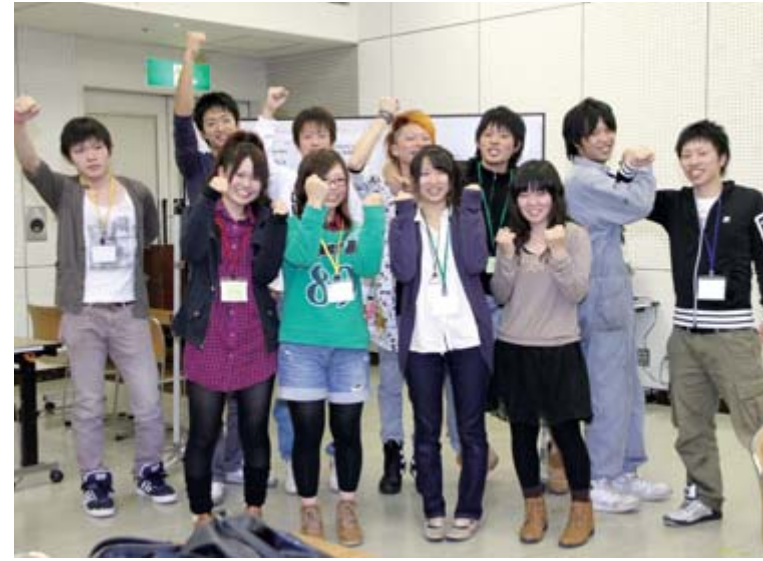
上／9月27日行われた4回目の会議に集まった成人式企画実行委員 左／班で考えた案をみんなの前で発表しました