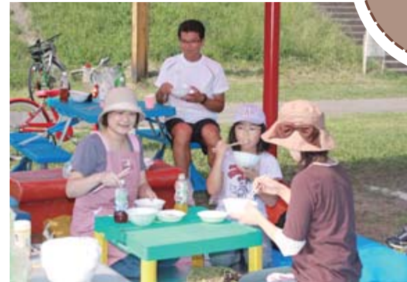
「とってもおいしかった」と大満足の家族連れ