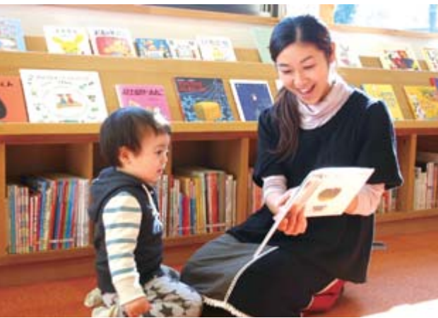
基本理念を「でかけよう ことばの海へ 知の森へ」と定め、期待と感動に心ときめく、市民のための図書館を目指します(写真は東山図書館)

新しい一関図書館の整備については、市民20人による整備計画委員会の基本構想、基本計画や候補地の協議・検討が進められ、8月30日、教育委員会に提言されました。 教育委員会では、この提言やパブリックコメントでいただいた意見を踏まえ、基本構想と基本計画については、提言に沿った内容で決定しました。 候補地については、▽一関文化センター競技場敷地▽磐井病院跡地の2カ所とする提言があり、市では市民の皆さんや議会の意見などを踏まえた結果、一関文化センター競技場敷地に