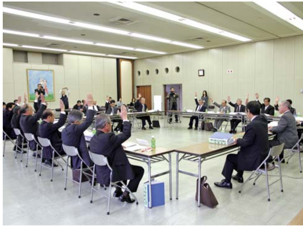
すべての協定項目の協議を終了した一関市・藤沢町合併協議会