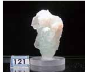
方解石(上の白い部分) と蛍石(下の部分)