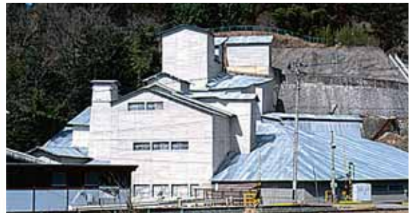
旧東北砕石工場(産業近代化遺産として文化財登録)