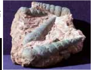
巻貝の化石 海緑(かいりょく)石