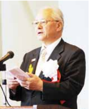
●市教育委員会委員長

急速な少子化の進行に伴い、学校規模の適正化は重要な課題の一つとなっています。地域活動の中心的役割を果たし、心のよりどころになってきた学校がなくなることは、地域の皆さんにとって苦渋の決断だったと察します。輝かしい実績と伝統を有する学校は、3月をもってその長い歴史に幕を閉じることになりました。しかし、統合しても、長年培われてきた伝統と歴史は失われることなく、継承しながら新しい一歩を踏み出してほしいと願っています。未来を担う子供たちが、未来に向かって力強く羽ばたく力を身につけられるよう、学校教育に取り組みます。