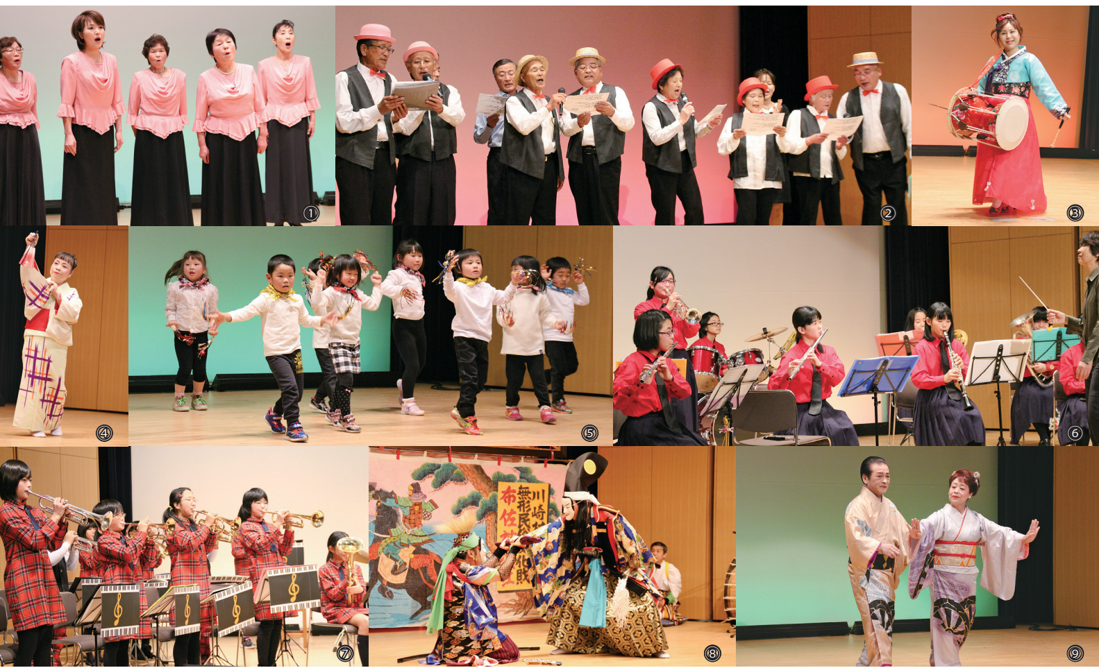
上段：舞台部門での各団体の発表(①川崎コーラスの会②かわさきカラオケ同好会③川崎21世紀国際交流クラブ④わらび会ゆうすげ教室⑤川崎保育園⑥川崎中学校吹奏楽部⑦川崎小学校金管バンド⑧布佐神楽保存会⑨生和会) / 下段：展示部門(⑩特別企画展「川崎いろはかるた」⑪陶芸・絵画作品)

I-Style Ichinoseki City Public Relations Magazine 12 December 2015