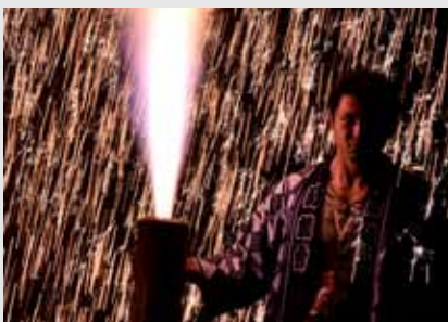
微動だにせず、火の粉に耐える挙げ手

魂ののろしをあげよ 七夕と花火彩る一関 第65回一関夏まつりの最後を締めくくった手筒花火は、愛知県三河地方に伝わる伝統の花火。 1メートルほどの竹筒に火薬を詰め、それを人が抱えながら放揚する。点火すると、轟音と共にオレンジ色の火柱が10数段も吹き上がる。 挙げ手は、降りしきる火の粉をものともせず、仁王立ちで花火を抱え続ける。筒から吹き上がる火柱が夜空を焦がす。最後は「ハネ」と呼ばれる炎が大音響とともに足元に勢いよく吹き出して幕を閉じる。