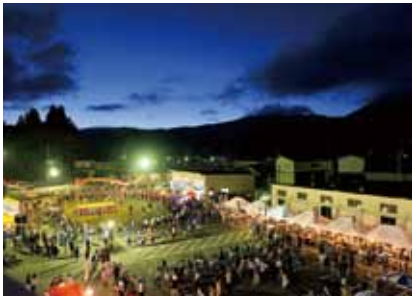
盆踊りに興じる参加者。熱を帯びた会場に室根音頭が鳴り響く(むろね夏まつり)