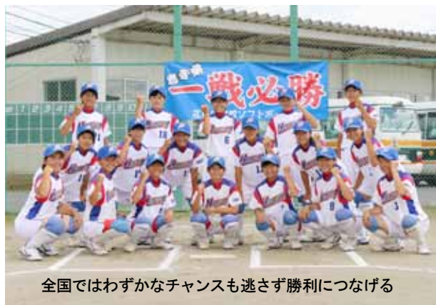
全国ではわずかなチャンスも逃さず勝利につなげる

8月7日に花巻市で行われた東北中学校体育大会で、花泉中が準優勝し、全国大会への切符を手にした。