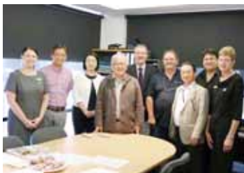
*1 右から4番目/*2 右から5番目

国際姉妹都市・豪州セントラルハイランズ市を市議会議員とともに訪問しました。ピーター・マグワイヤー前市長(*1)がケリー・ヘイズ市長(*2)を紹介。懇談ではオーストラリア公園寄贈と中学生海外派遣事業について感謝の気持ちを伝え、今後さらに交流を深め合うことを確認しました。