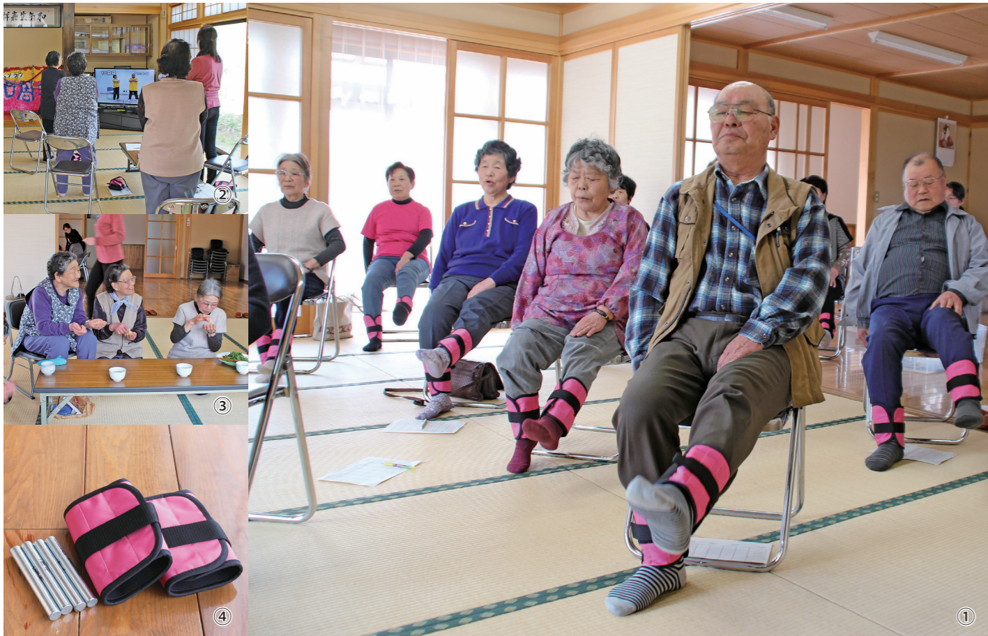
①いきいき百歳体操をする参加者/②DVDを見ながら体操/③体操の後はみんなで楽しくお茶飲み/④負荷をかけるためのおもり