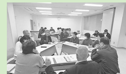
実施事業を検討する専門部会の様子

いよいよ本格的に事業に取り組んでいく段階になりました。より多くの地域住民の参画による地域づくりを推進していきたいと思っております。